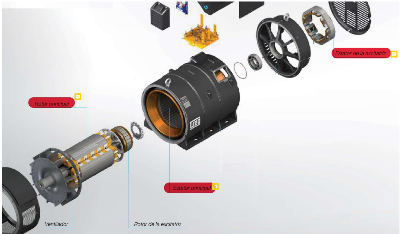
Figura 2: Rotor e estator principal do alternador WEG linha AG10 a serem recuperados.